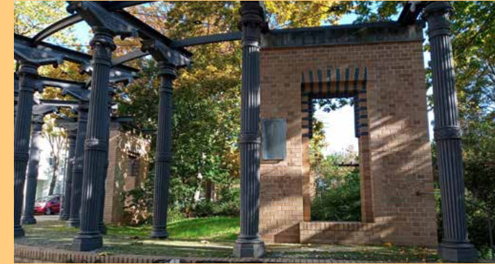
Denkmal Hartungssäulen