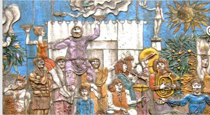
Kunst im Öffentlichen Raum, Keramik-Stele von Werner Petrich